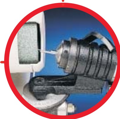
"T" index za krajšanje