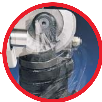
skala z merilom